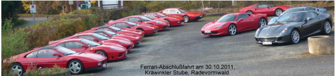
Ferrari-Abschlußfahrt am 30.10.2011, Kräwinkler Stube, Radevormwald.